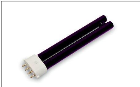
Safescan 50 / 70 UV lamp